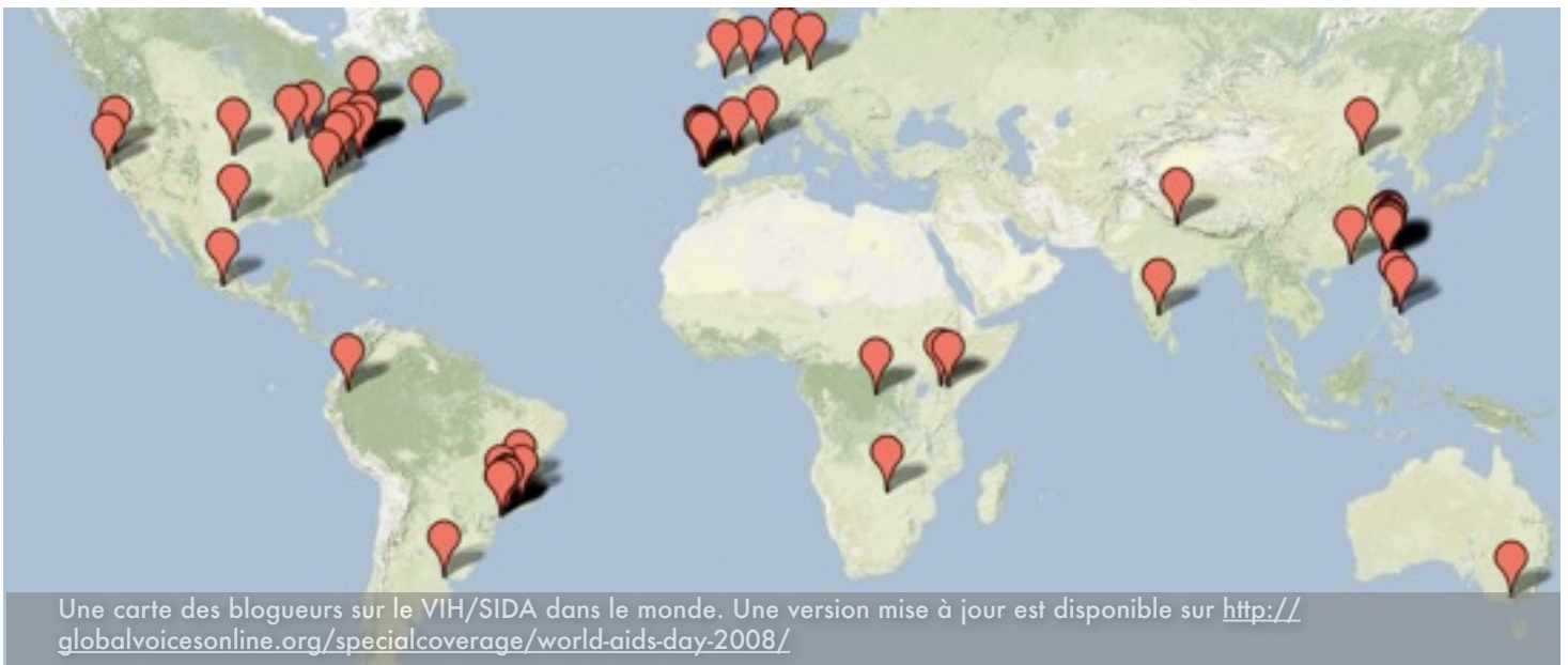
Une carte des blogueurs sur le VIH/SIDA dans le monde. Une version mise à jour est disponible sur http://globalvoicesonline.org/specialcoverage/world-aids-day-2008/

blogueurs dans le monde, beaucoup vivant avec le VIH/SIDA qui écrivent régulièrement sur des sujets relatifs au VIH/SIDA. Sur notre carte interactive (lien ci-dessus) se trouve la liste des blogueurs que nous avons identifiés, et nous acceptons tout ajout au répertoire.