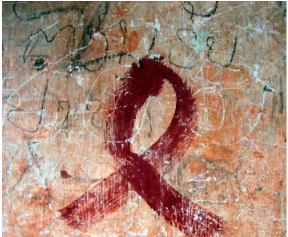
Art de la rue en Birmanie pour sensibiliser la population sur le VIH et le SIDA. La circulation de l'information en Birmanie est contrôlée, censurée et restreinte. HIV Information for Myanmar utilise un blog pour la rendre disponible.. him.civiblog.org